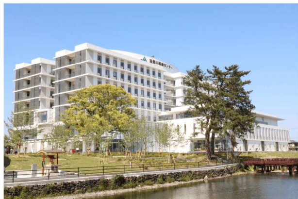
吉野川医療センター (吉野川市鴨島町)