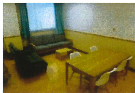
デイルームのソファコーナーとミニキッチン