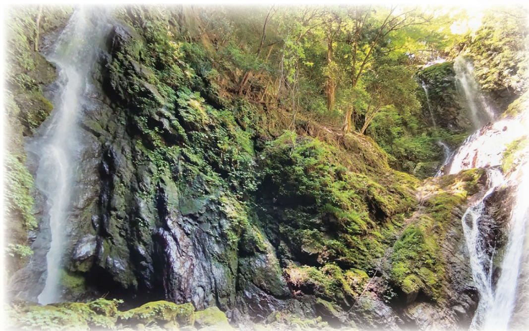
雨乞の滝

患者さんや地域の方々、そして職員からも選ばれる病院になれるよう取り組んでまいりますので、今後ともよろしくお願い申し上げます。