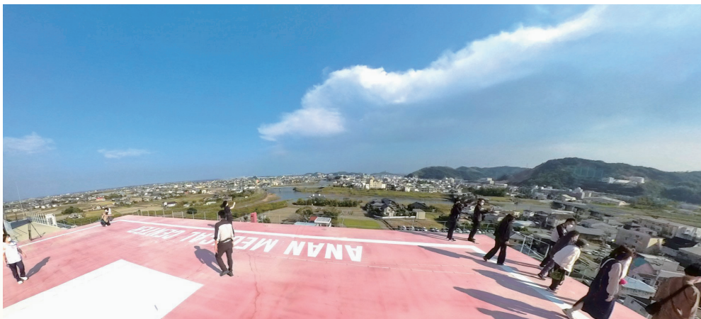
ヘリポート見学ツアー

さらなる救急医療の充実も必要で、難しい課題ではありますので、今後とも、ご指導ご鞭撻をいただければ幸いです。