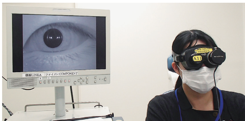
赤外線 CCD カメラによる眼振検査